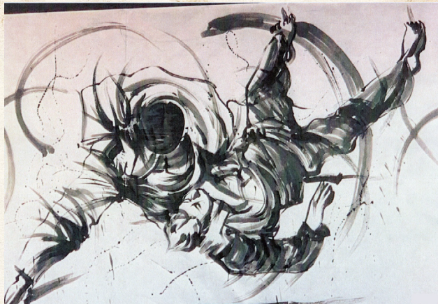
Un dessin spontané fait lors des championnats du monde de Tokyo. L'auteur est inconnu, son talent ne l'est pas.